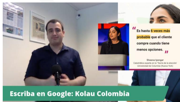
Grafica 3. Socialización via facebook live del programa de digitalización de MINTIC