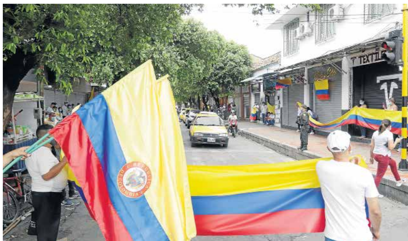
Sin obstaculizar el paso de vehículos, los peleteros de Cúcuta se manifestaron en el andén frente a sus negocios para advertir que los bloqueos en las vías nacionales han impedido el arribo de insumos a la ciudad.

“41 civiles y un miembro de la Fuerza Pública han muerto en el marco de las protestas en Colombia”, informe de la Defensoría del Pueblo.