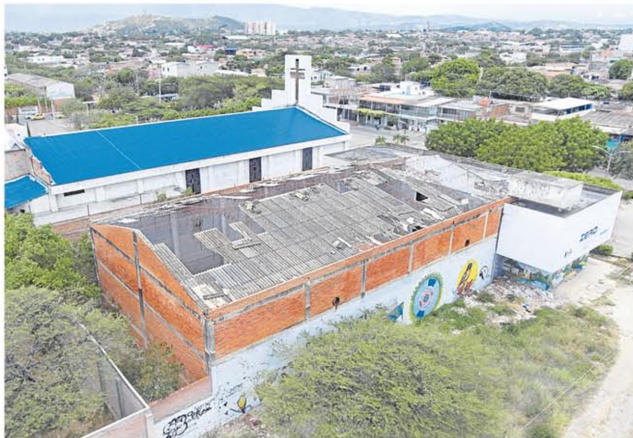
Las instalaciones del Teatro Atalaya, donde hoy rueda la 'película del abandono', también han sido afectadas por la inseguridad, puesto que poco a poco se han ido robando las tejas del techo.