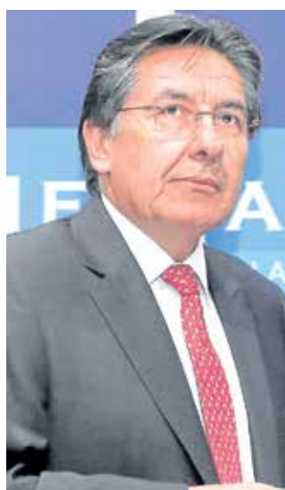
FISCAL Néstor Humberto Martínez

El presidente Iván Duque declaró ayer que Colombia no cohabitará con el narcotráfico al referirse a la decisión de la JEP de no autorizar la extradición del exguerrillero de las Farc, Jesús Santrich, capturado en 2018 por supuestamente participar en el envío de cocaína a Estados Unidos.