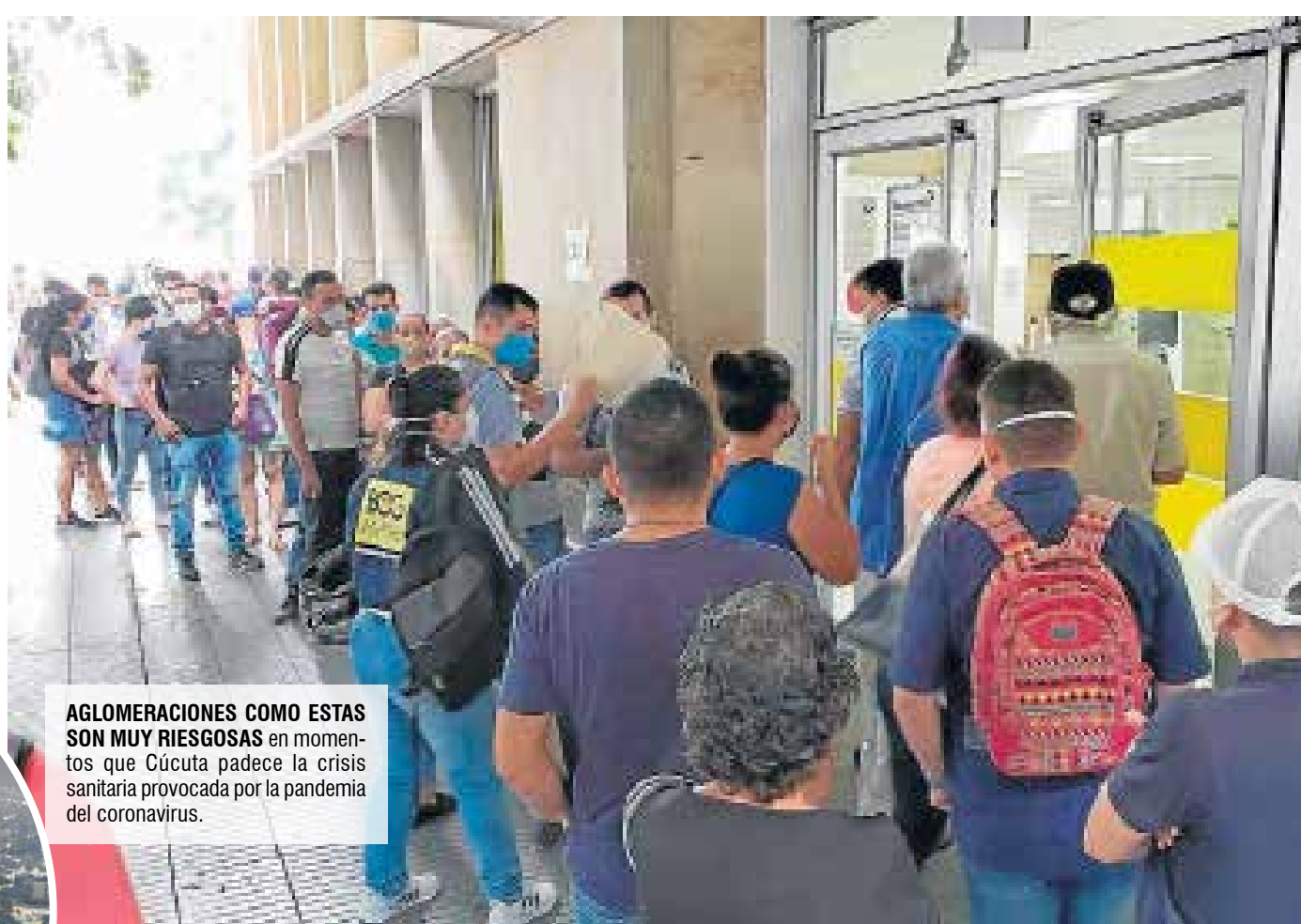
AGLOMERACIONES COMO ESTAS SON MUY RIESGOSAS en momentos que Cúcuta padece la crisis sanitaria provocada por la pandemia del coronavirus.